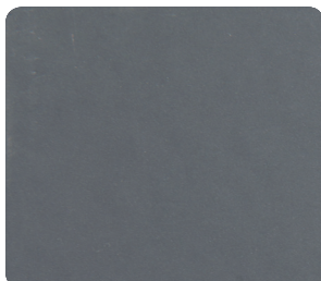
Graphite Grey (närmsta RAL 7024)