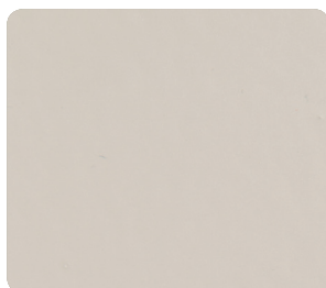
Silk Grey (närmsta RAL 7044)