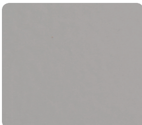
Dusty Grey (nærmeste RAL 7037)